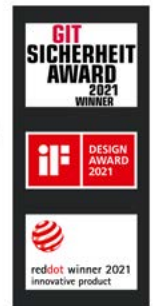
Cámaras de sensores multifocales Panomera®

seguridad para la Planta II con componentes del portfolio de Dallmeier, consistiendo en cámaras de sensores multifocales Panomera®, cámaras domo megapíxel, el sistema de grabación IPS 10.000 y el software de gestión de vídeo SeMSy® Compact.