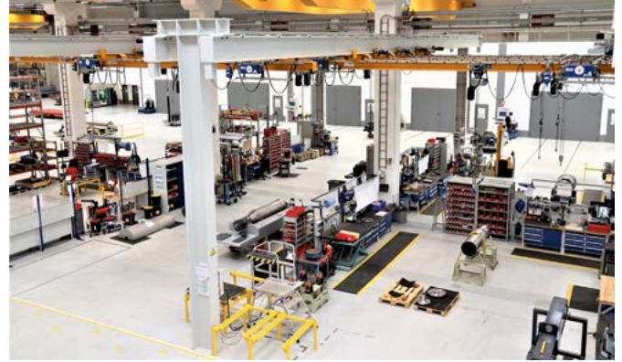
Nave industrial y planta de producción de las centrifugas Flottweg