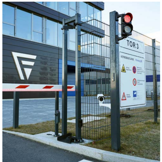
Gestión de acceso mediante reconocimiento de matrículas con cámaras box y solución ANPR de Dallmeier