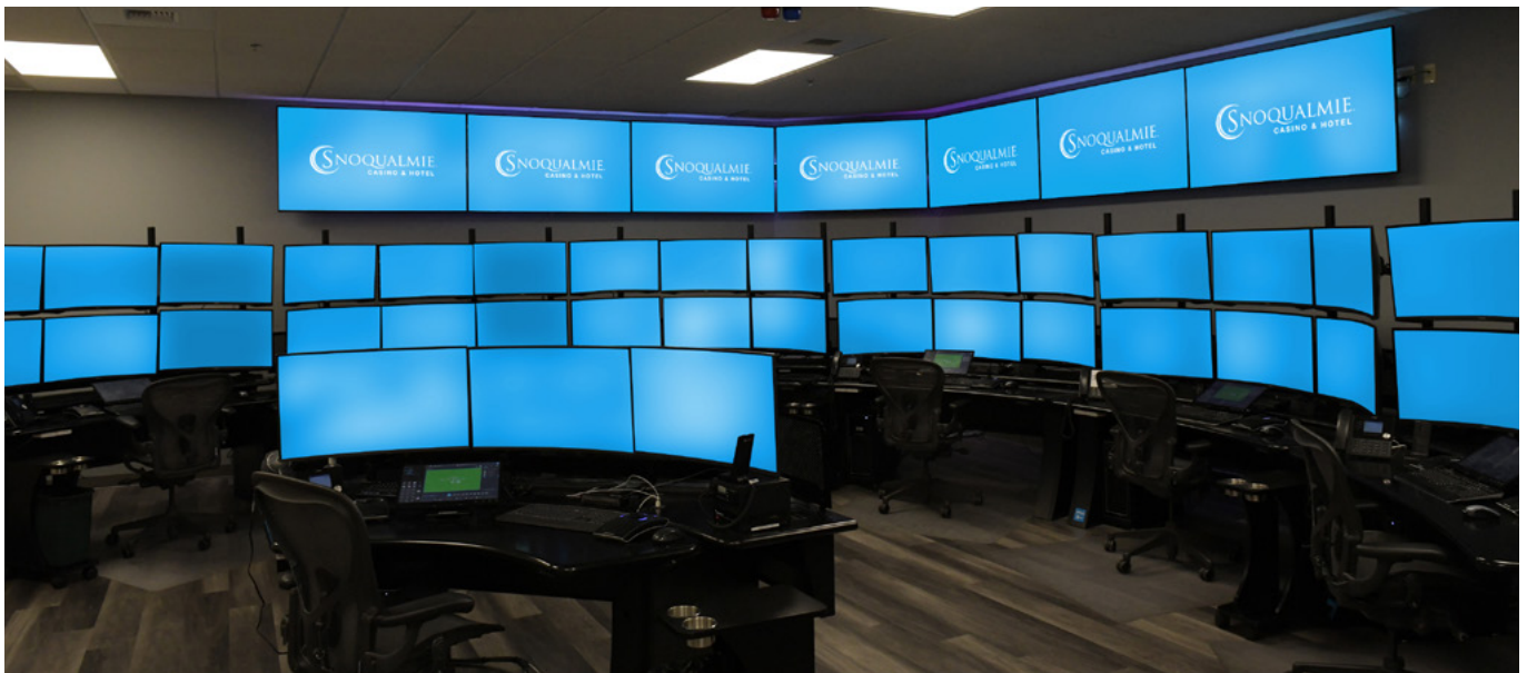
Im Überwachungsraum laufen die Videodaten von über 1.500 Dallmeier Kameras zusammen.